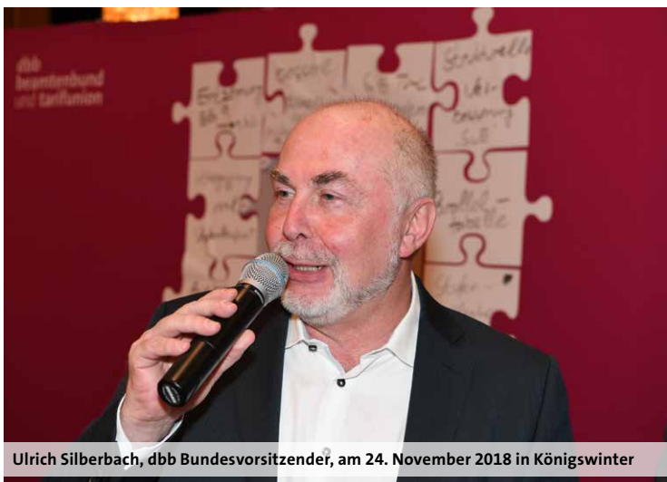
Ulrich Silberbach, dbb Bundesvorsitzender, am 24. November 2018 in Königswinter

„Die fehlende Wertschätzung für die Bildungsarbeit durch qualifizierte Pädagogen muss ein Ende haben“, forderte der dbb Bundesvorsitzende Ulrich Silberbach auf dem Branchentag am 24. November 2018 in Königswinter vor mehr als 150 VBE-Mitgliedern. Dabei gehe es aber nicht darum, die Quereinsteiger in den Lehrerberuf gegen die grundständig ausgebildeten und erfahrenen Lehrkräfte auszu-