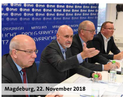
Magdeburg, 22. November 2018